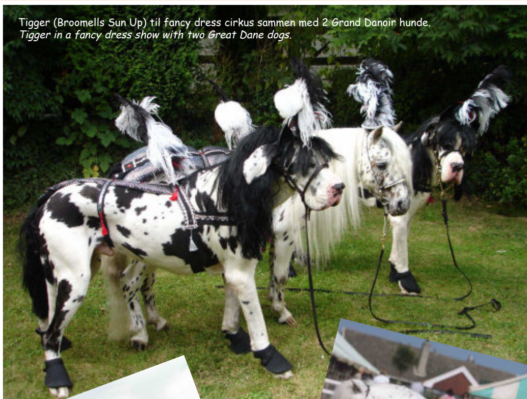
Tigger (Broomells Sun Up) til fancy dress cirkus sammen med 2 Grand Danoir hunde. Tigger in a fancy dress show with two Great Dane dogs.