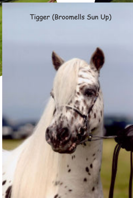
Tigger (Broomells Sun Up)