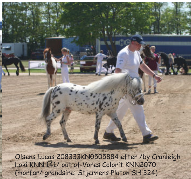
Olsens Lucas 208333KN0505884 efter /by Cranleigh Loki KNN 141/ out of Vores Colorit KNN2070 (morfar/ grandsire: Stjernens Platon SH 324)

Majco's Equus Maximus KNN 180 efter/ by Broomells Salvo KNN 115/ out of Moonshinefarm Fatina Blush KNN 1868 (morfar/ grand sire: Wantsley Tintangel S86/1)