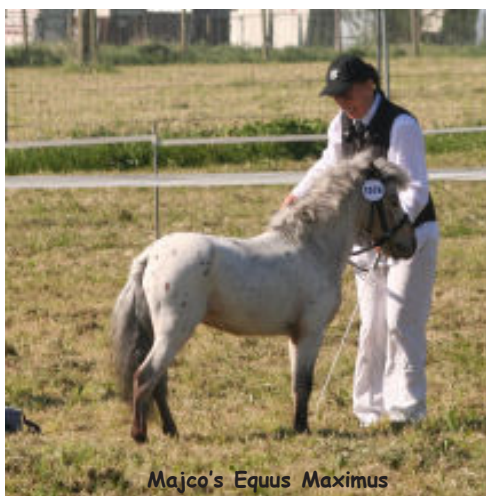
Majco's Equus Maximus