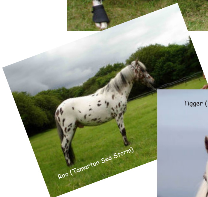
Roo (Tamarton Sea Storm)