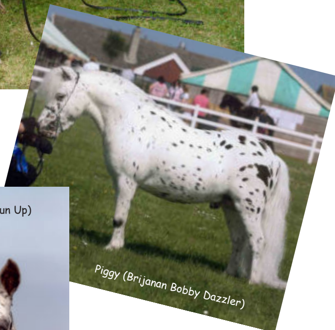
Piggy (Brijanan Bobby Dazzler)