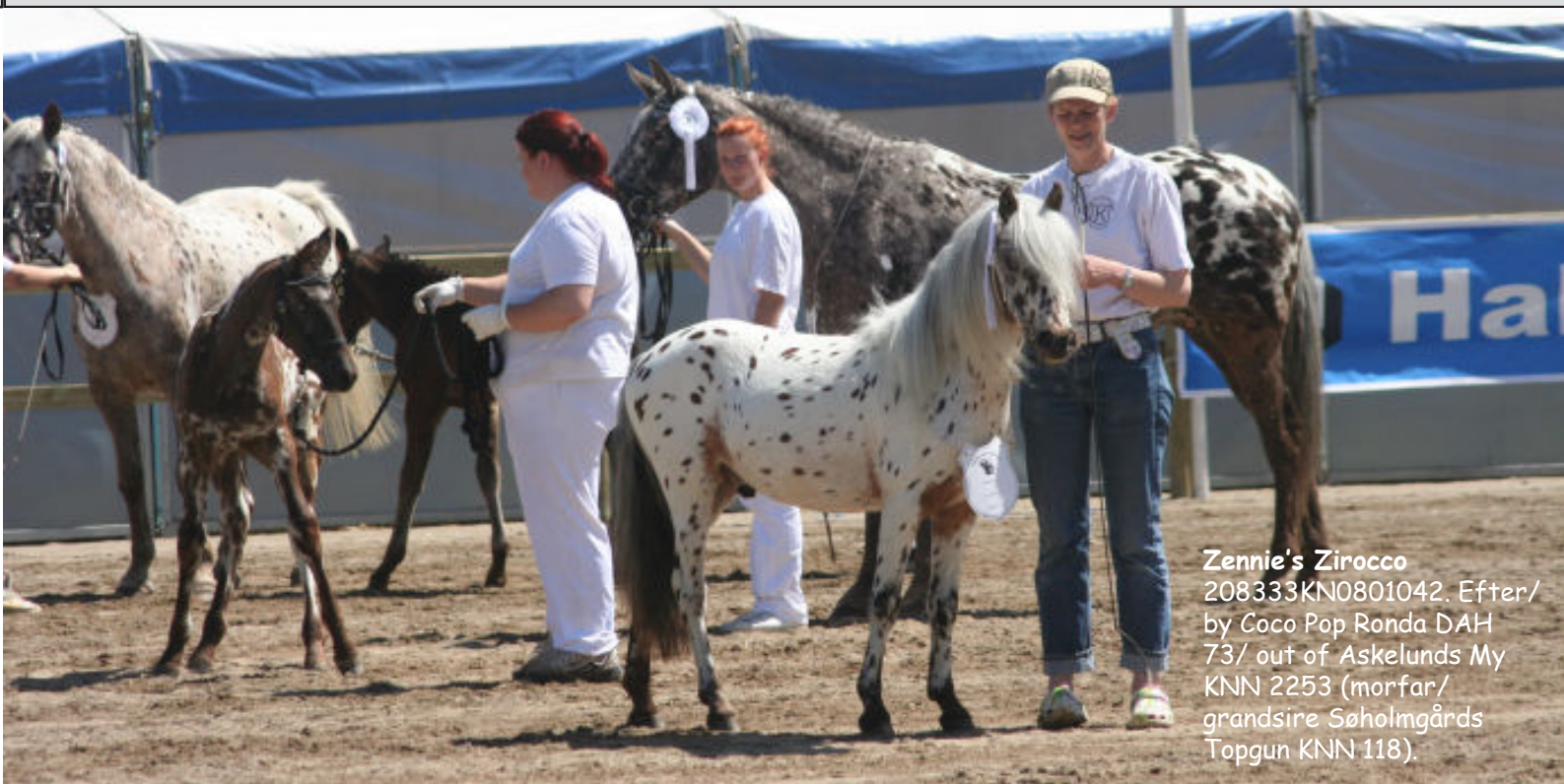
Zennie's Zirocco 208333KN0801042. Efter/ by Coco Pop Ronda DAH 73/ out of Askelunds My KNN 2253 (morfar/ grandsire Søholmgårds Topgun KNN 118).

Dyrskue traditionen i Danmark er temmelig gammel. Der kom rigtig gang i det efter 1852, idet der blev vedtaget en lov om husdyrpræmier. Der var ikke mere kongelige stutier og avl, og derfor var det nødvendigt at fremavle kvalitet både til landbruget og til krig (det var lige efter 1. slesvigerkrig) på anden vis.