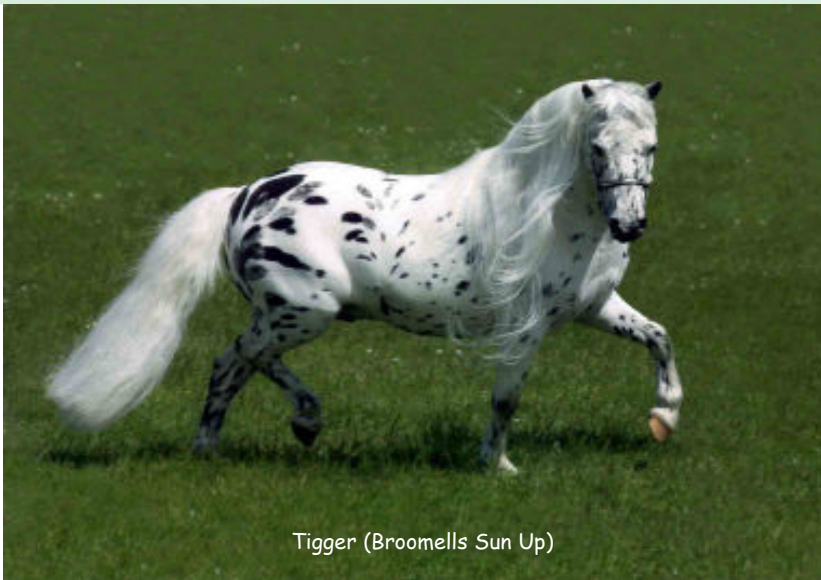
Tigger (Broomells Sun Up)